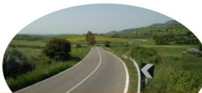
VIABILITÀ: ANGELO CARTA E LA MESSA IN SICUREZZA DELLA SS 387