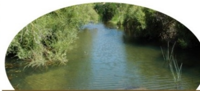
RALLY DI SARDEGNA BIKE IN OGLIASTRA LA SFIDA CONTINUA