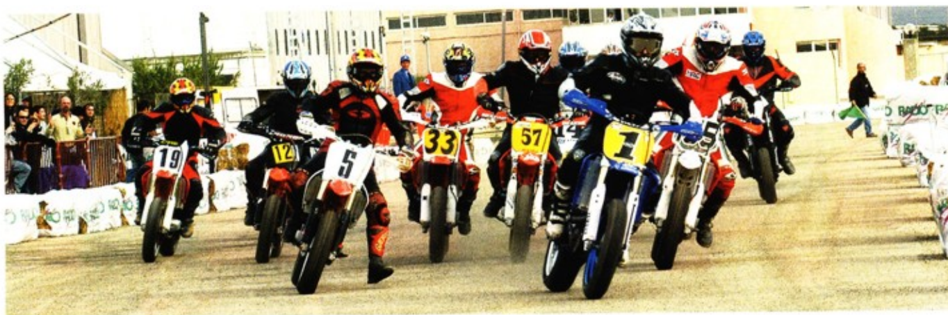
Lo start del gruppo A.

ASSOLUTA: 1. GIRAUDO (VER) 19 (10+9); 2. GASPARDONE G. (HON) 19 (9+10); 3. ORECCHIONI (KTM) 16 (8+8); 4. LONGHINI (HON) 14 (7+7); 5. GASPARDONE P. (HON) 10 (6+4); 6. PEDOUZZA (HON) 9 (3+6); 7. MOLLA (KTM) 7 (5+2); 8. MONNI C. (HON) 7 (2+5); 9. BAROLI (KTM) 4 (4+0); 10. NIOI (YAM) 3 (0+3); 11. BELLU (HON) 2 (1+1).